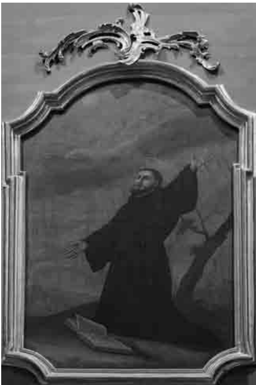
Il. nr 3. Św. Józef z Kupertynu . Prawa kulisa ołtarza głównego kościoła Franciszkanów w Przemyślu. Wiek XVIII.