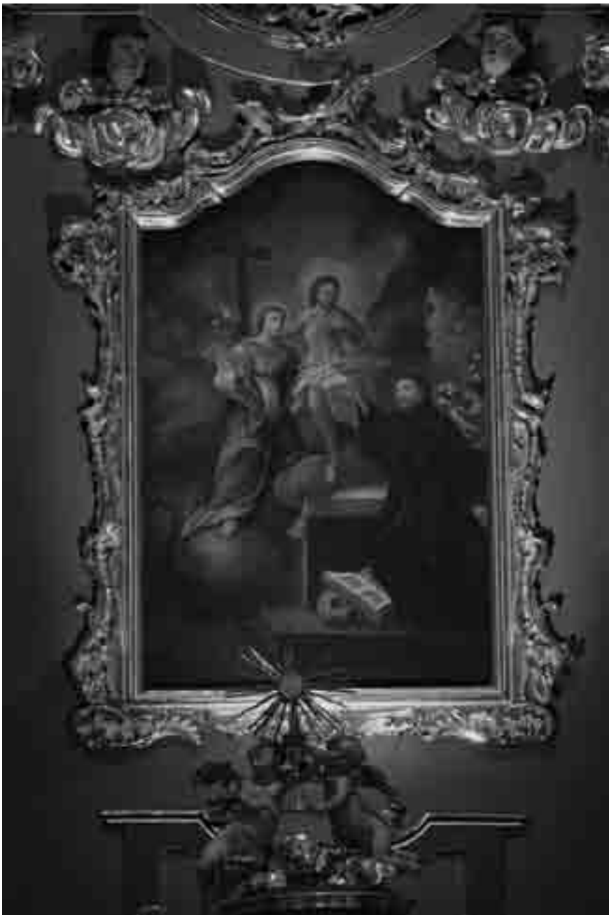
Il. nr 2. Nadanie odpustu Porcjunkuli św. Franciszkowi z Asyżu. Zasłona cudownego obrazu Matki Bożej Niepokalanej w centralnej części ołtarza głównego kościoła Franciszkanów w Przemyślu. Wiek XVIII.