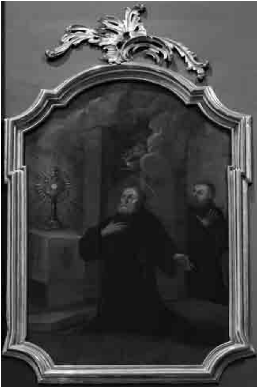
Il. nr 4. Bł. Bonawentura z Potenzy . Lewa kulisa ołtarza głównego kościoła Franciszkanów w Przemyślu. Wiek XVIII.