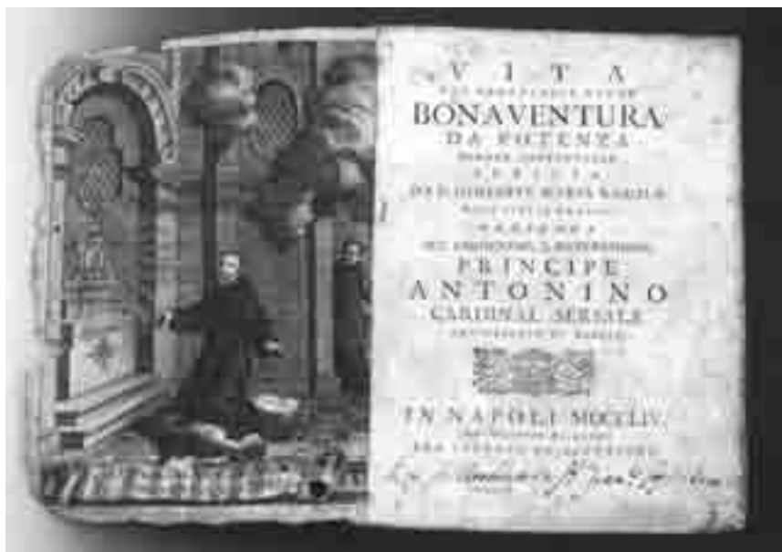
Il. nr 4. Bł. Bonawentura z Potenzy. Przedbeatyfikacyjne, miedziorytnicze przedstawienie Vita del venerabile padre Bonaventura da Potenza minore conventuale. Wydane w Neapolu w 1754 roku.