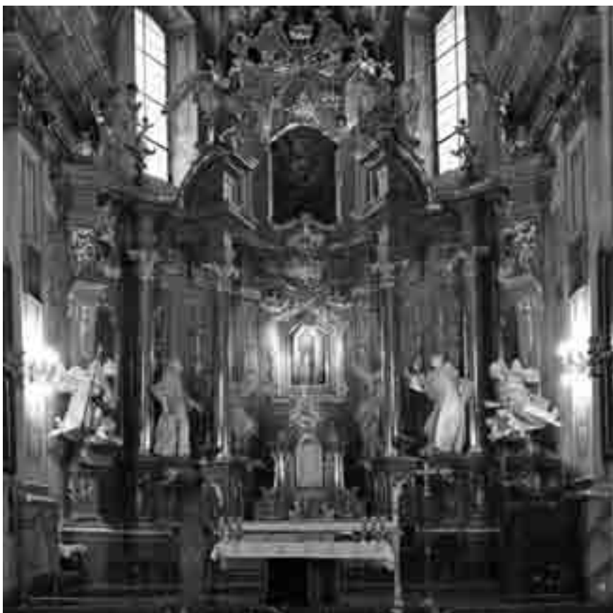
Il. nr 1. Ołtarz główny kościoła Franciszkanów w Przemyślu.