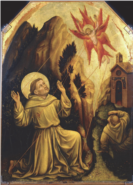
Il. 7. Gentile z Fabriano, Stygmatyzacja św. Franciszka z Asyżu , 1411 r.

Reminiscencją przedstawienia Giotta jest obraz autorstwa Gentile z Fabriano z roku 1411 21 . Obraz zachwyca rozbudowaną kompozycją tła, które stanowi przyroda z kaplicą pustelni. Widoczny jest także zakonnik towarzyszący Franciszkowi. Serafin w ognistych niemalże skrzydłach oraz sposób ukazania drzew, dają wrażenie jakby wszystko na przedstawieniu płonęło.