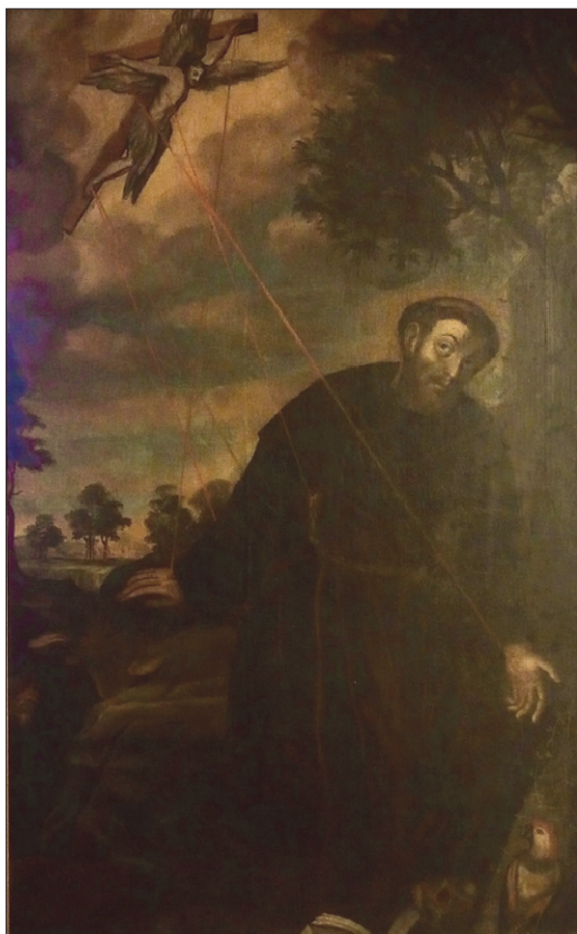
Il. 13. Stygmatyzacja św. Franciszka , XVII w. Klasztor franciszkanów w Sanoku.

Elementy kompozycyjne Giotta zachowuje obraz pochodzący z XVIII w., jaki przechowywany jest w klasztorze franciszkanów w Sanoku. Do stałych elementów kompozycyjnych autor przedstawienia dodał jednak zieloną papugę, która jest symbolem naśladowania – widz winien stawać się naśladowcą św. Franciszka w jego świętości; jest także symbolem dziewictwa 27 .