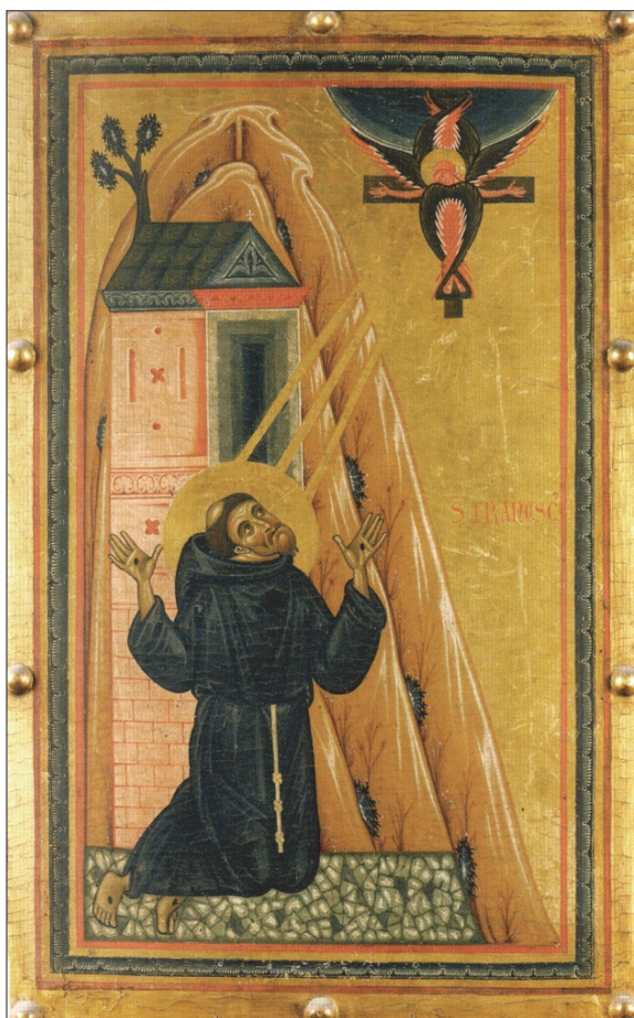
Il. 4. Maestro della Croce, Św. Franciszek otrzymuje stygmaty, lata 40. XIII w.

W tym samym okresie Maestro della Croce namalował obraz przedstawiający stygmatyzację. Podobnie jak i w poprzednim przedstawieniu, scena jest uboga, statyczna, bez dodatków. Obraz prezentowany jest w zbiorach Galerii Uffizi.