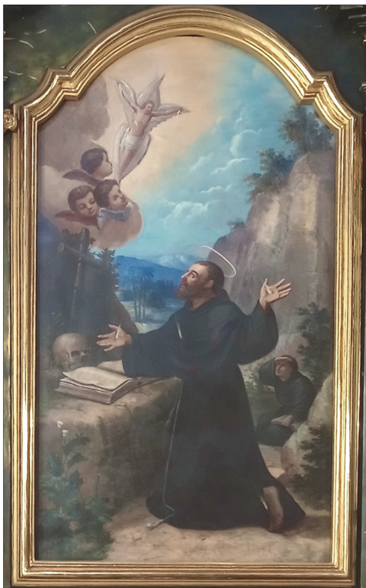
Il. 18. Stigmatyzacja św. Franciszka , przełom XVIII/XIX w. Klasztor franciszkanów w Przemyślu.

Kompozycję Giotta zauważyć można również na obrazie w oltarzu kościoła franciszkanów w Przemyślu. Została ona wzbogacona o fakt modlitwy św. Franciszka przed krzyżem stojącym na skalnej półce, na której także widnieje czaszka i otwarta księga.