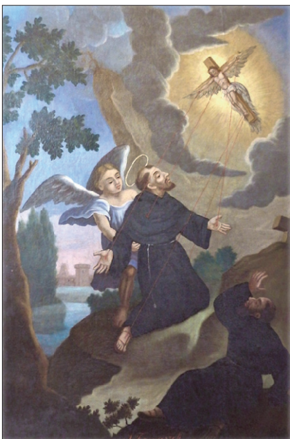
Il. 16. Stygmatyzacja św. Franciszka , XVIII w. Klasztor franciszkanów w Kalwarii Paclawskiej.

W klasztorze franciszkanów w Kalwarii Paclawskiej przechowywany jest także obraz o podobnej kompozycji jak omówiony wyżej fresk. Można dojść do wniosku, że kompozycja sceny stygmatyzacji św. Franciszka, którego podtrzymuje anioł, zaczerpnięta jest z miedziorytu Klauberów z XVIII w.