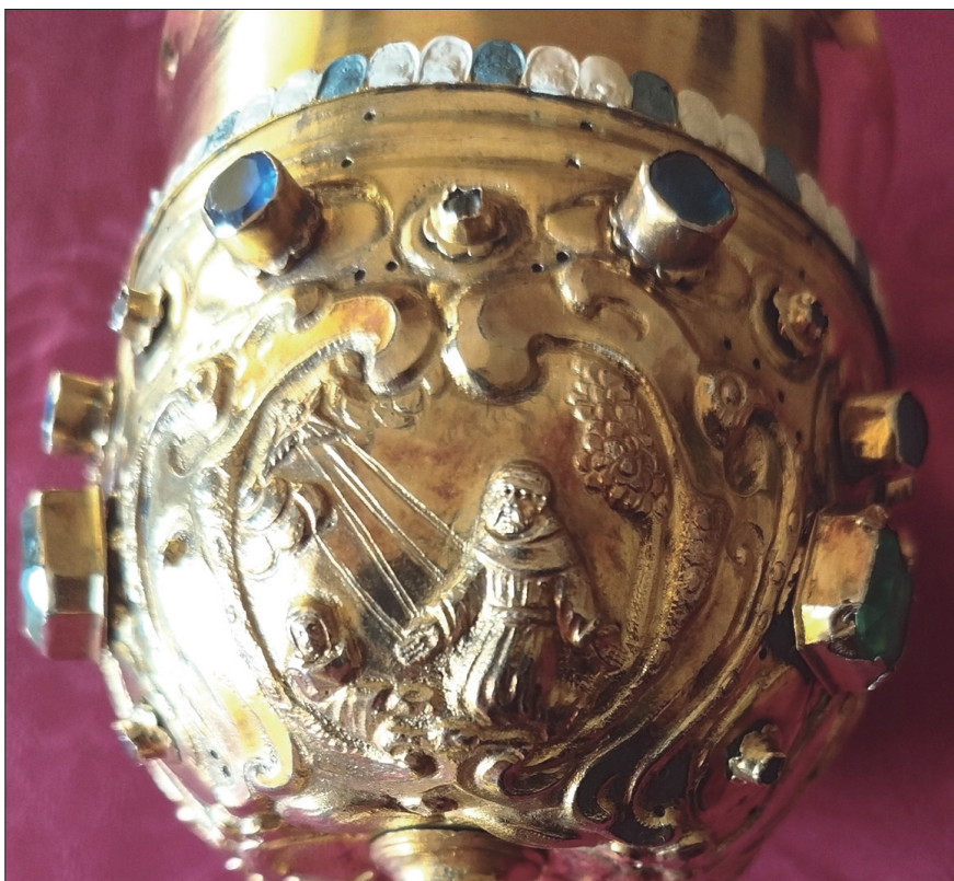
Il. 14. Dekoracja koszyczka kielicha mszalnego, przed 1668 r. Klasztor franciszkanów w Przemyślu.

Kompozycja jednego z plafonów sklepienia nawy bocznej w Bazylice Znalezienia Krzyża Świętego w Kalwarii Paclawskiej powiela przedstawiane motywy z tą różnicą, że na fresku kalwaryjskim autor umieścił postać anioła, który podtrzymuje św. Franciszka 29 . Być może jest to nawiązanie do sceny modlitwy w Ogrójcu, kiedy Jezus umacniany był w swoim cierpieniu przez anioła (por. Łk 22, 43).