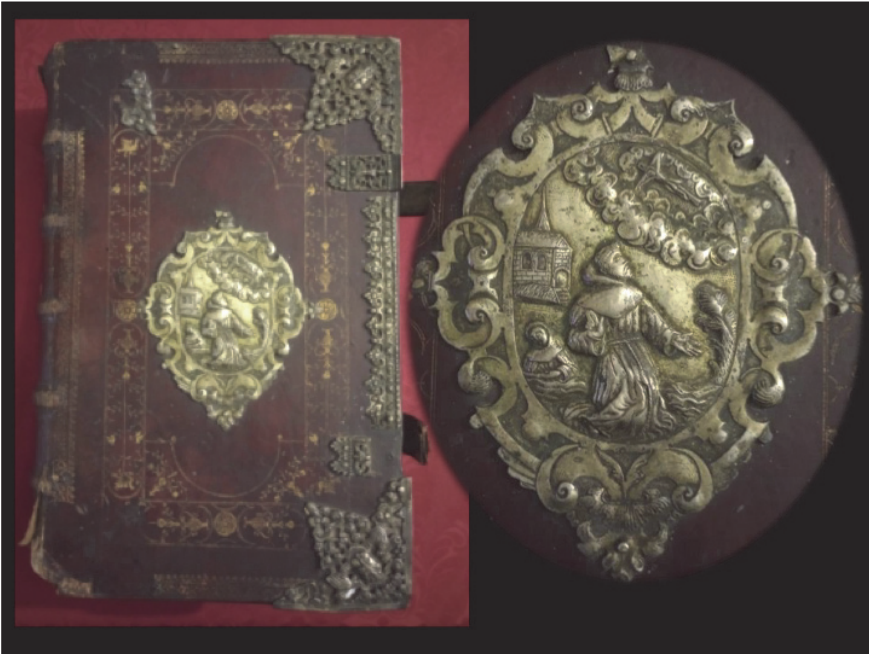
Il. 11. Stygmata św. Franciszka . Plakietka okładki Breviarium Romanum , 1614 r. Klasztor franciszkanów w Przemyślu.