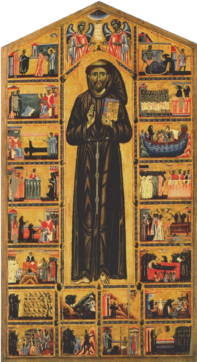
Il. 5. Coppo di Marcovaldo, San Francesco e venti storie della sua vita , lata 1245-1250.