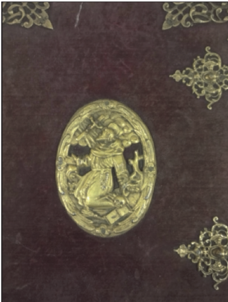
Il. 12. Stygmata św. Franciszka . Plakietka, XVIII w. Klasztor franciszkanów w Przemyślu.