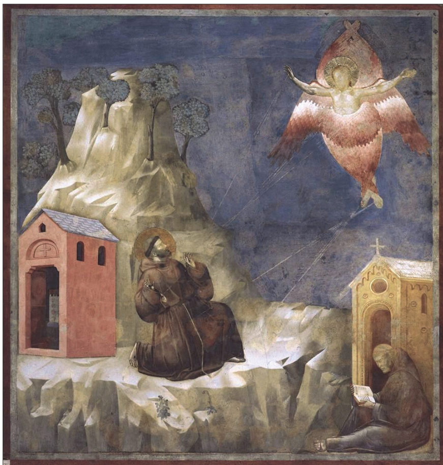
Il. 6. Giotto di Bondone, Stygmatyzacja św. Franciszka z Asyżu .

W roku 1263 wydany został Życiorys większy św. Franciszka , autorstwa św. Bonawentury 19 . Publikacja wspomnianego dzieła przysłużyła się do sposobu przedstawiania sceny stygmatyzacji św. Franciszka oraz innych scen hagiograficznych. Bez wątpienia opublikowane dzieło miało wpływ na wykonany w latach 1291-1294 cykl fresków zawierających sceny z życia św. Franciszka w bazylice św. Franciszka w Asyżu, przez włoskiego malarza Giotto di Bondone 20 .