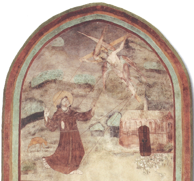
Il. 10. Stygmatyzacja św. Franciszka , lata 1440-1445. Krużganki klasztoru franciszkanów w Krakowie.

Chrystusa jako serafina. W oddali widoczny zarys klasztoru, a całość kompozycji dopełnia wyrazisty pejzaż z uwidocznionymi górami i bogatą roślinnością. Na fresku nie ma zakonnika towarzyszącego Franciszkowi, malarz jednak umieścił tu jednorożca, który jest symbolem cnotliwości 26 .